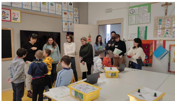
Scuola Primaria Senza Zaino di Velo: attività di robotica